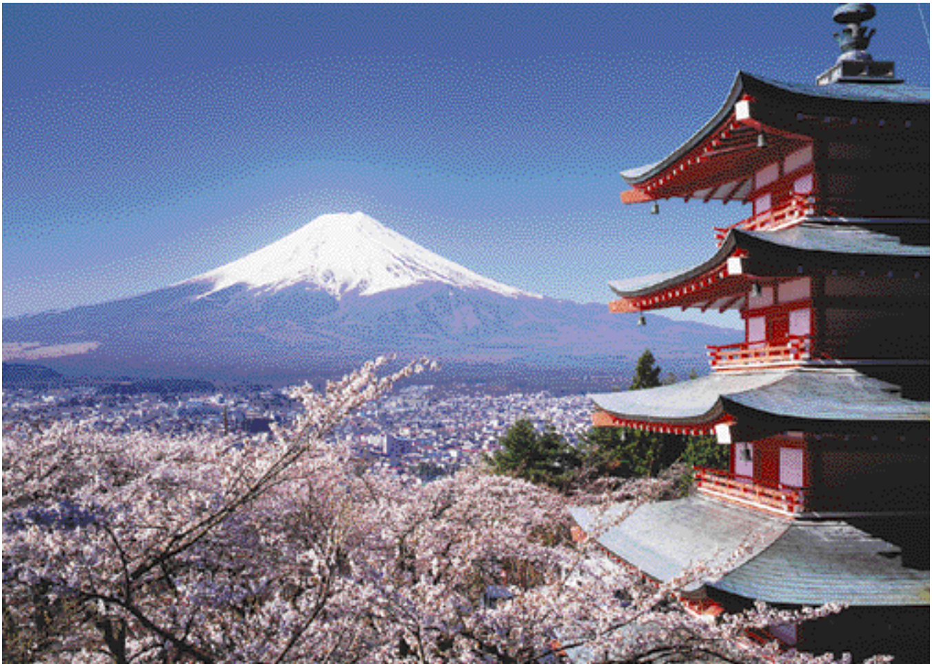
富士山の眺望が美しい浅間公園から

http://www.city.fujiyoshida.yamanashi.jp/div/gikai/html/index.html